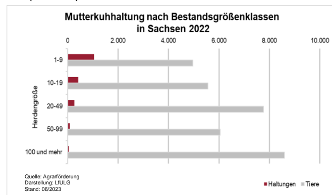
Abb. 2: Mutterkuhhaltung nach Bestandsgrößenklassen in Sachsen in 2022

Die Mutterkuhhaltung konzentriert sich hier in Folge der schwierigen Mechanisierbarkeit der Flächen auf die grünlandreichen Gebirgs- und Vorgebirgslagen sowie auf die Flussniederungen mit Überschwemmungs-, Naturschutz- bzw. Vogelschutzgebieten. Im Jahr 2022 wurden im Rahmen der Agrarförderung 1.863 Haltungen mit insgesamt 32.926 Tieren der Mutterkuhhaltung erfasst. Dabei hielten entsprechend der Auswertung der Agrarförderanträge durch das LfULG 56 % der Halter rund 15 % des Tierbestandes in Herdengrößen zwischen 1 bis 9 Tieren. Insgesamt 2,9 % der Haltungen hielten mehr als 100 Tiere und bildeten ca. 26 % des Tierbestandes ab (Abb. 2).