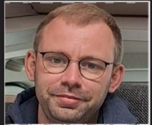
Wissenstransfer (FBZ Wurzen)