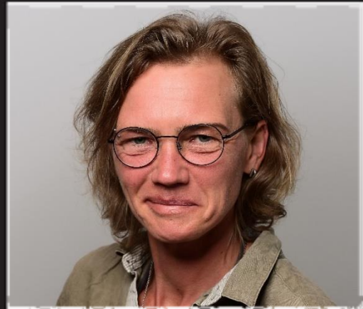
Landwirtschaft und Naturschutz (Referat 63, Freiberg)