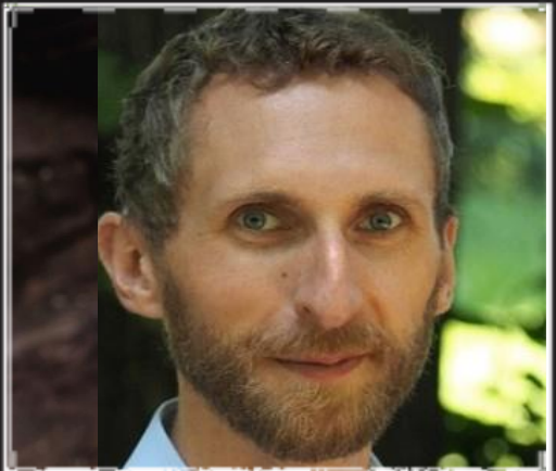
Agroenergie und Nachwachsende Rohstoffe (Referat 71, Nossen)