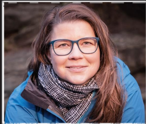
Regional- Vermarktung (Referat 21, Dresden Pillnitz)