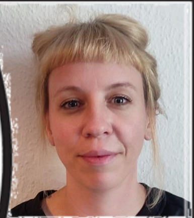
Gewässer- und auenschonende Landwirtschaft (FBZ Wurzen)