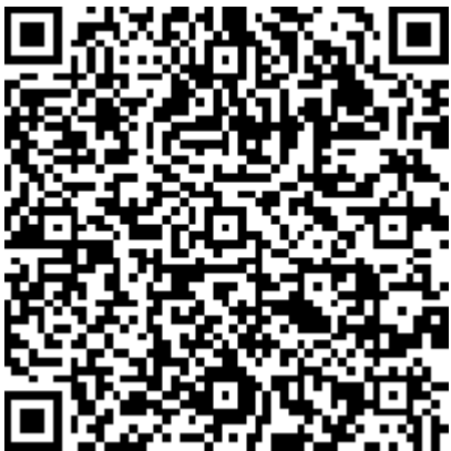
Link zur Projekt-Website